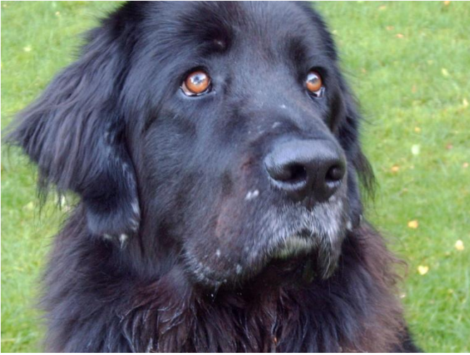
Ramses im Jahr 2008