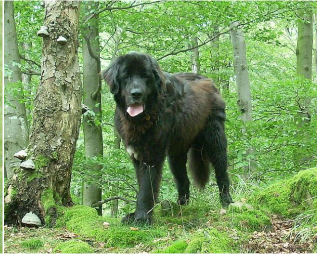
und im August 2011

Ramses kam vor etwas über sechs Jahren im Alter von zwei Jahren über die Neufundländer Nothilfe zu uns. Sehr schnell nach dem Tod unseres Neufundländers Bingo hat er signalisiert, dass er zu uns gehören möchte. Er hat sehr lange benötigt, bis er ganz bei uns angekommen zu sein schien. Und genauso schnell, wie er damals zu uns gekommen ist, hat er uns nun Ende September 2011 wieder verlassen. Er ist nur acht Jahre alt geworden. Diese acht Jahre waren jedoch erfüllt von großem innerem Wachstum, und wir sind sicher, dass alles gut und richtig ist, so wie es ist. Trotz alledem vermissen wir ihn sehr. Ich habe ihm mein Buch gewidmet, das Buch, das von seinen Freunden Zebulon und Kater Jonny Lee und ganz unmerklich und heimlich, auch von ihm initiiert wurde. Dieses Buch möchte unser Bewusstsein stärken für alles Leben, was uns umgibt und die Achtung vor allen Wesen dieser Welt.